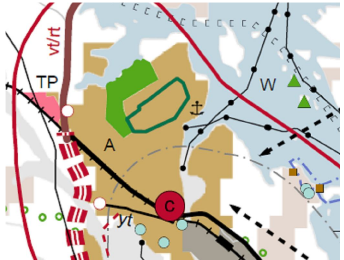
Kuva: Ote Keski-Suomen maakuntakaavasta

Suunnittelualueella on voimassa Keski-Suomen maakuntakaava (ympäristöministeriön 14.4.2009 vahvistama). Suunnittelualueesta osalle on osoitettu taajamatoimintojen aluetta (A). Alue on kaupunkikehittämisen kohdealueen (kk2, Äänekosken kaupunkialue) sisällä.