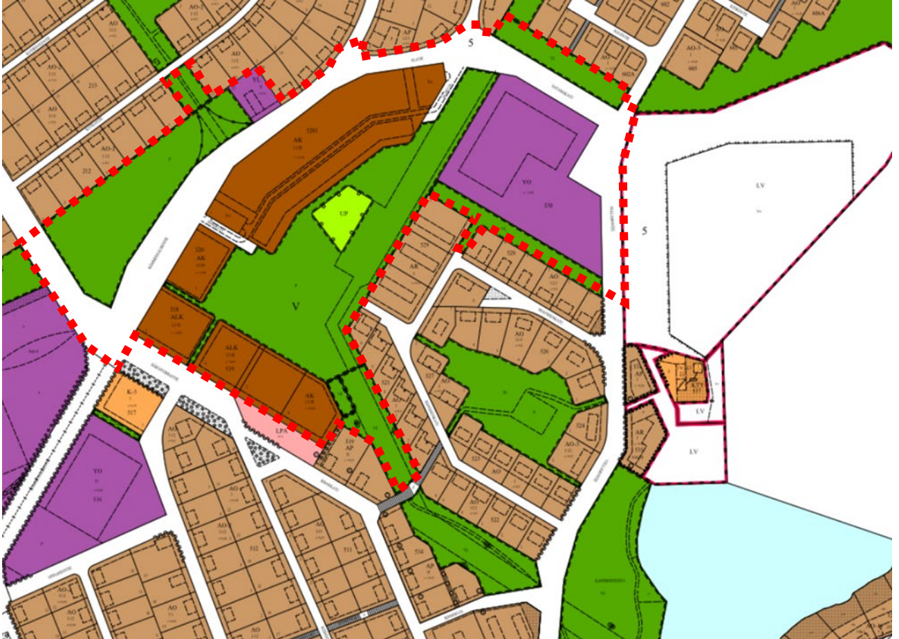
Kuva 3. Ote voimassa olevasta asemakaavasta. Suunnittelualue on rajattu punaisella.

Voimassa olevassa asemakaavassa suunnittelualueelle on osoitettu asuntokerrostalojen korttelialuetta (AK) sekä yhdistettyjen liike- ja asuntokerrostalojen korttelialuetta (ALK). Alueelle on osoitettu myös opetustoimintaa palvelevien rakennusten korttelialue (YO) ja julkisten lähipalvelurakennusten korttelialue (YL). Lisäksi alueelle on osoitettu puistoaluetta (P), palloilukenttä (UP), lähivirkistysaluetta (VL) sekä leikkikenttä (VK).