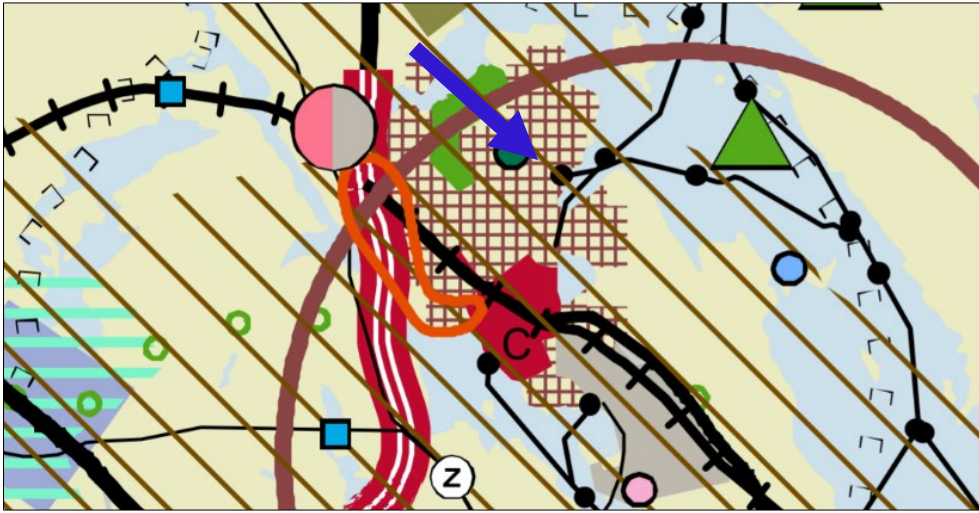
Kuva 1. Ote tarkistetusta Keski-Suomen maakuntakaavasta. Suunnittelualueen sijainti on osoitettu sinisellä nuolella.