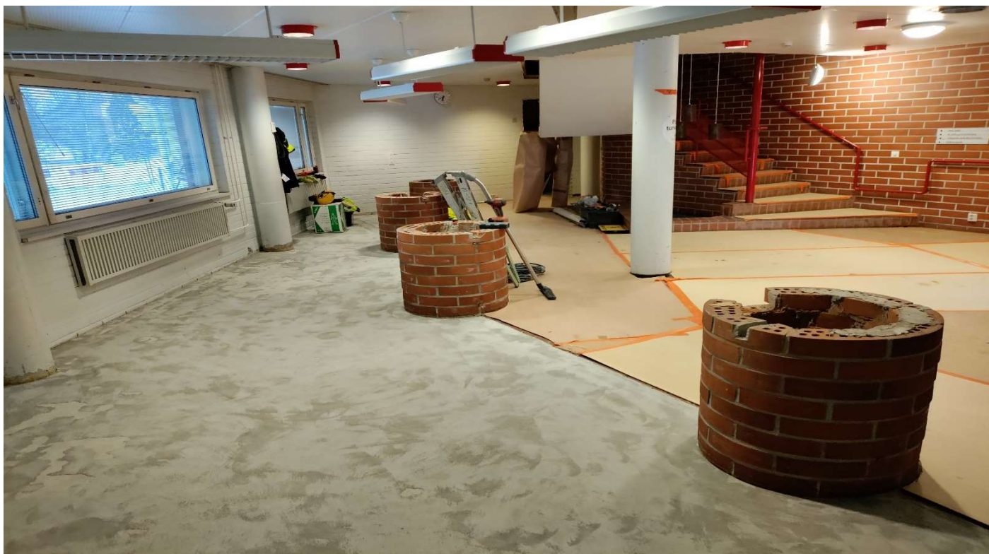
Aula suojattu ja vinyylilaatat purettu pois. Tiskistä on vielä jäljellä muuratut perustukset.