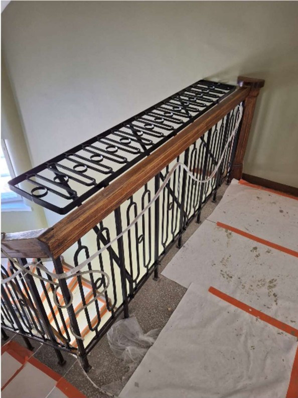
Vanhaan porrashuoneen kaiteeseen on asennettu vaakaan lisäkaide. Vanha kaide on liian matala.