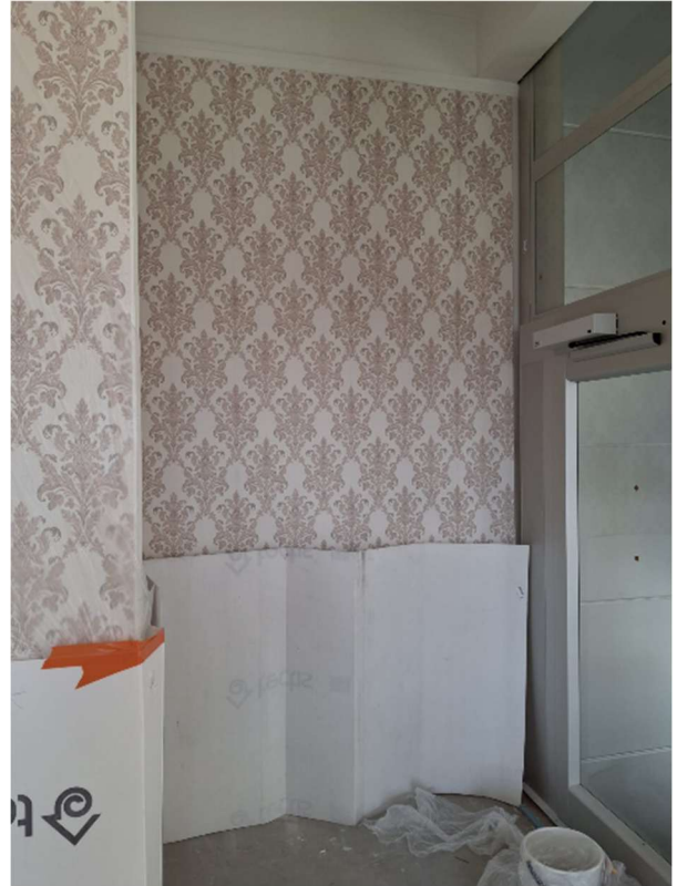
Viimeiset tapetit on asennettu paikoilleen.