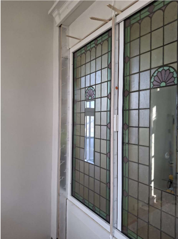
Lyijymosaiikkilasin takapuolelle asennetaan turvalasit. Kuvassa vasemmanpuoleisessa ikkunassa on turvalasi jo paikallaan.