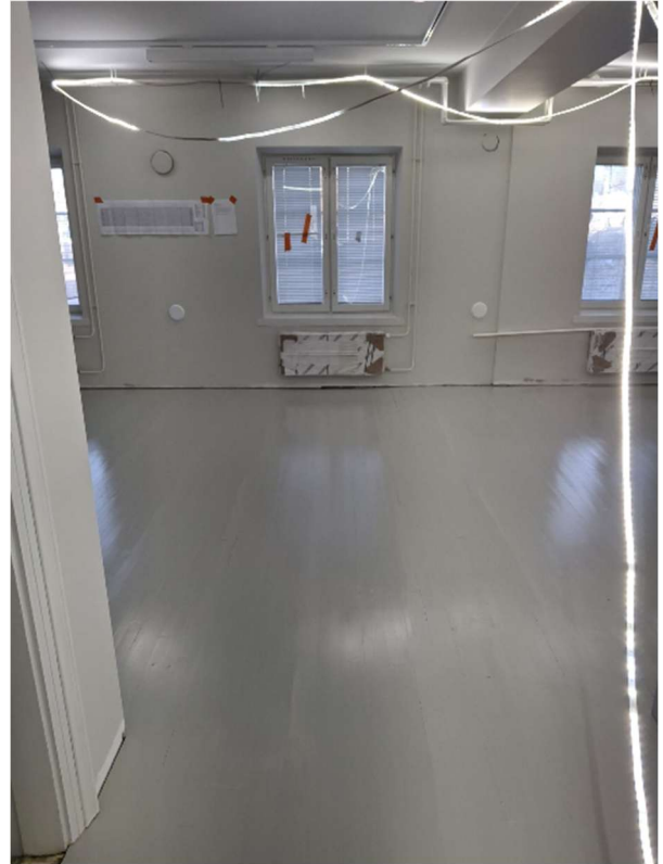
Viimeisiä lautalattioita on maalailtu.