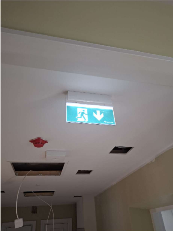
Työmaalla tehty sähkö- ja turva-asennuksia. Kuvassa poistumistien merkkivalo.