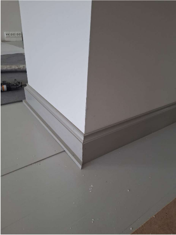
2. kerroksen jalkalistoitukset käynnissä. 2. kerroksessa on hieman erilaisen profiilin jalkalistat, kuin 3. ja 1. kerroksissa.