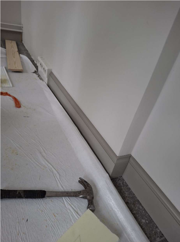
2. kerroksessa jalkalistan asennus tulee tällä viikolla pääosin valmiiksi.