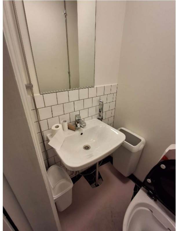
WC- ja siivoustiloihin on asennettu peilit ja osa varusteista. Paperiannostelijat, yms. asennetaan myöhemmin.