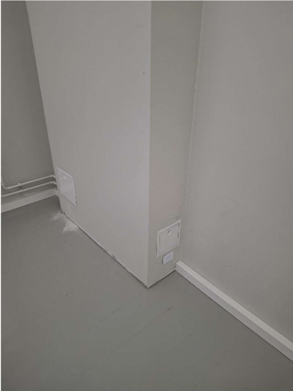
Tarkastusluukkuja on asennettu tekniikkakoteloihin ja alakattoihin.